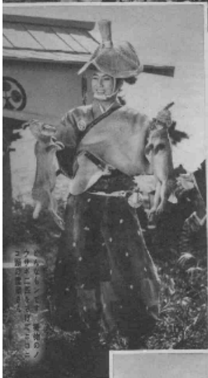
八千草さん、雷蔵さんの ラブシーン、そして雷蔵さんの ゴキゲンシーン